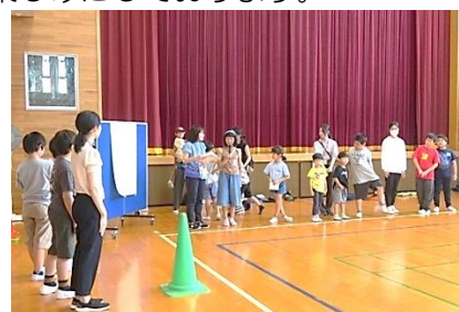
特別支援学級交流会