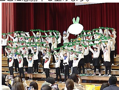
1年「エンジョイ♪ミュージック!!」