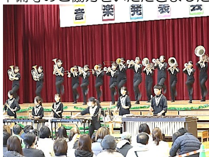
金管バンド「『ゆめの森』の風を感じて」

11月15日(土)に、音楽発表会を行いました。たくさんの保護者の皆様、地域の皆様においでいただき、ありがとうございました。どの学年も、日頃の学習の成果を伝えよう、よりよい表現をしようとして一生懸命に練習を重ねてきました。感染症の流行で発表が延期した学年がありましたが、大勢のお客さんの前で、緊張しながらも精一杯の発表をすることができ、皆で心を合わせ歌ったり合奏したりする楽しさや目標に向かって頑張る大切さ、協力して発表を作り上げるすばらしさを感じたことと思います。保護者の皆様、地域の皆様には、会場でたくさんの拍手をいただくとともに、これまでの励ましや準備等のご協力をいただきましたことに感謝申し上げます。