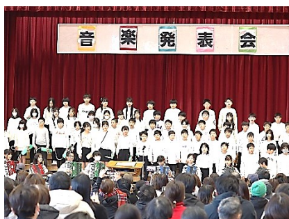
5年「劇場版5年生〜いのちの歌と大怪盗」