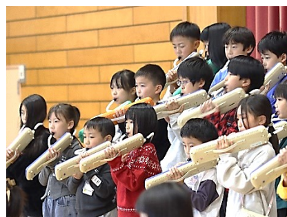
3年「カラフルズとドラゴン」