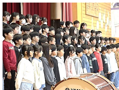
6年「挑戦〜心を一につに〜」

2年生は、学年閉鎖のため音楽発表会での発表ができませんでした。12月10日(水)のフリー参観の日に発表を行います。時間や場所など詳細が決まりましたら、学年だより等でお知らせします。